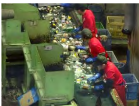
正月明け早々から大量の処理作業が続く現場

12月の作業実績は12日間でおよそ60時間。総選別量は前月比15%増の約99トンだった。年末年始を乗り切ったとは言え、忙しい時期は続く。体調管理に気を遣う季節でもあり、全員が一丸となり作業に取り組んでいる。