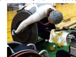
① 鏡に向かいひたすら2時間こぎ続ける

ロンドン五輪金メダリスト、東京パラリンピック招致アンバサダー…土田さんを知ろうとすると輝かしい経歴と、美しい容姿がまず浮かぶ。しかし誰しもがそうであるように悩み、苦しい局面もあった。むしろ成功よりも失敗の方が多かった。それでも目標があり、家族の支えがあるから頑張れる。彼女の言葉は障がいのあるなしに関わらず多くの人に希望を与える。(4頁に続く)