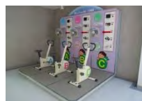
建物の2階にはリサイクルの説明や発電体験のコーナーも