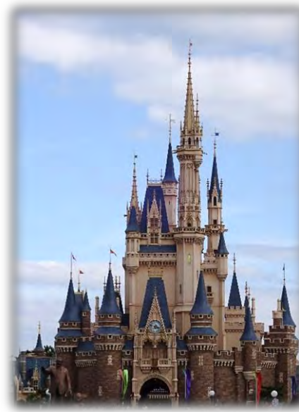
夏祭りの気分も味わえる装いのパーク内日頃の疲れを忘れて夢の国を楽しんだ

働く目的はそれぞれだ。それがあから頑張れる…それを確認できた一日だったのではないかな。