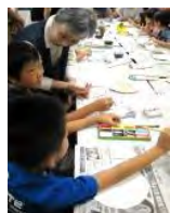
①初めての経験にどきどきわくわくの参加者

「紙すきをしてはがきを作る 作ったはがきに絵を描こう」と題したワークショップが8月21日、総合福祉センターで開かれ、子どもたちが手助けを受けながらオリジナルのはがき作りに取り組んだ。多摩市内の婦人科・赤枝医院で出産した方の交流会に端を発した、遊びや仕事を通じ自分で街をつくりあげていこうという、新しい形の「フェス」KAOFES。その関連企画「KAOART」の子どもを対象にしたイベントで、自分ですいて作ったはがきに思い思いの絵を描いた。