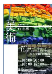
③パルテノン多摩で開かれる美術作品展は入場無料。毎年さまざまな作品が並ぶ